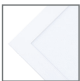
biała obudowa z mlecznym kloszem