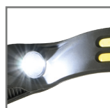
czas pracy: do 6h