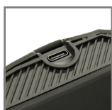
ładowanie za pomocą USB-C