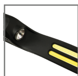
elastyczna i wygodna budowa