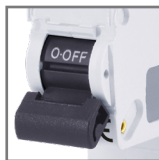
możliwość plombowa- wania