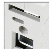
możliwość połączenia za pomocą szyn grzebieniowych