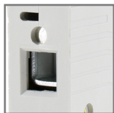
pojemność zacisków: max. 25mm 2