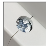
zaciski ze stali ocynkowanej