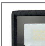
szkło z powłoką „frosted glass”