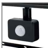
zintegrowany czujnik ruchu PIR