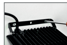
prosty montaż oprawy bez konieczności odkręcania uchwytu