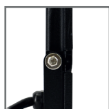
śruba uchwyty montażowego