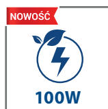
nowe wersje i większa wydajność świetlna