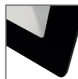
wytrzymałe szkło hartowane