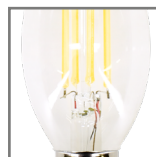
bańka wykonana ze szkła