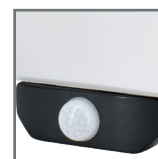
zintegrowany czujnik na podczerwień