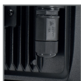
hermetyczna dławnica IP68