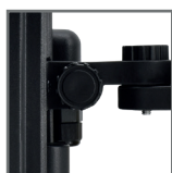
beznarzędziowa regulacja i podłączenie elektryczne