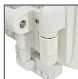
dwie wersje kolorystyczne obudowy