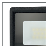
szkło z powłoką „frosted glass”