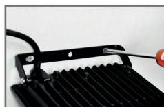
prosty montaż oprawy bez konieczności odkręcania uchwytu