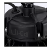
zewnętrzny zasilacz LIFUD*