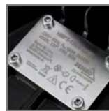
grawerowana tabliczka znamionowa