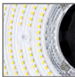
wymienne soczewki 120° / 90°