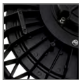
radiator odprowadzający ciepło