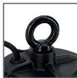
uchwyt M10 do montażu wiszanego