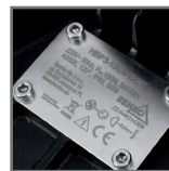
grawerowana tabliczka znamionowa