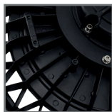
radiator odprowadzający ciepło