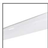
dwa typy klosza: mleczny, pryzmatyczny