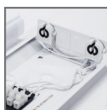
oprawki G13 na źródła T8*