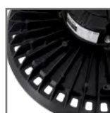
wysoka efektywność odprowadzania ciepła