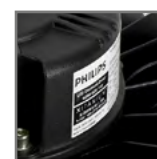
zasilacz PHILIPS Xitanium z możliwością sterowania 1-10V