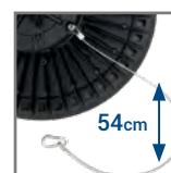
w zestawie stalowa linka zabezpieczająca