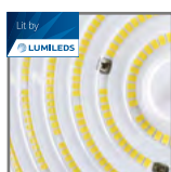
wysokowydajne źródło światła PHILIPS LUMILEDS