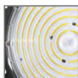
wymienne soczewki 60° / 90° / 120°