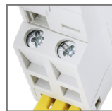
max. poj. zacisków głównych: do 6mm 2