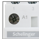
max. poj. zacisków pomocniczych 2.5mm 2