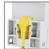
montaż na szynie DIN35