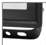
uchwyt pod kątem 45° ułatwiający montaż