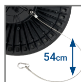
w zestawie stalowa linka zabezpieczająca