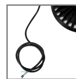
długość przewodu: 30cm (±10%)