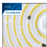
wysokowydajne źródło światła PHILIPS LUMILEDS