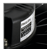
zasilacz PHILIPS Titanium z możliwością sterowania 1-10V i zmiany mocy