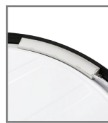
zasilacz dopasowany do ramki