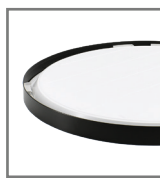
brak widocznych śrub montażowych