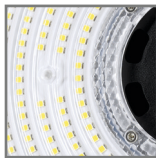
wymienne soczewki 120° / 90°