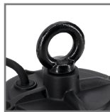
uchwyt M10 do montażu zwieszanego