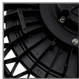
radiator odprowadzający ciepło