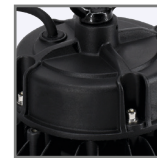
zewnętrzny zasilacz ze sterowaniem 0-10V lub DALI