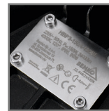
grawerowana tabliczka znamionowa