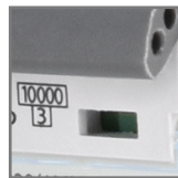
kontrolka sygnalizująca zadziałanie