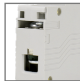
możliwość połączenia za pomocą szyn grzebieniowych