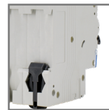
montaż na szynie DIN35