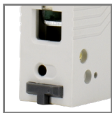
pojemność zacisków: max. 25mm 2