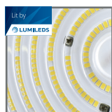
wysokowydajne źródło światła PHILIPS LUMILEDS