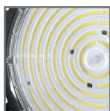
wymienne soczewki 60° / 90° / 120°