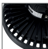
wysoka efektywność odprowadzania ciepła