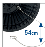
w zestawie stalowa linka zabezpieczająca