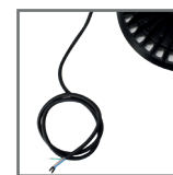
długość przewodu: 150cm (±10%)