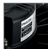
zasilacz PHILIPS Xitanium z możliwością sterowania 1-10V