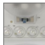
możliwość zmiany temperatury barwowej