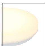
idealne rozproszenie światła na kloszu